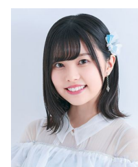
地頭江 音々 (HKT48)