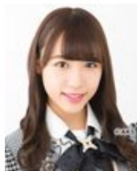
山本 瑠香 (NMB48)